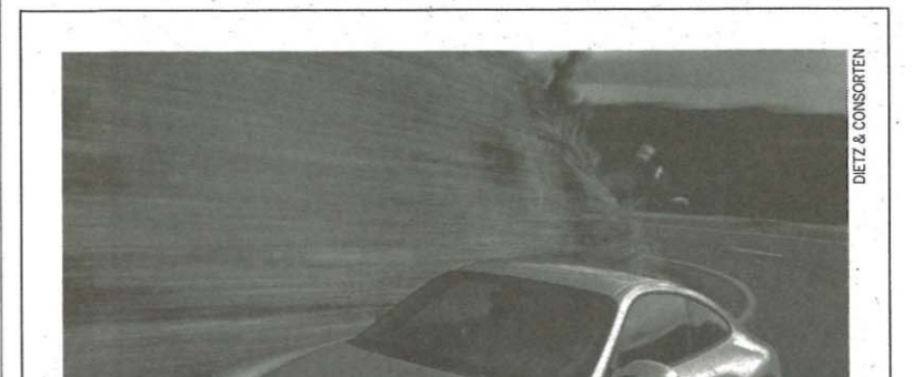
DIETZ & CONSORTEN